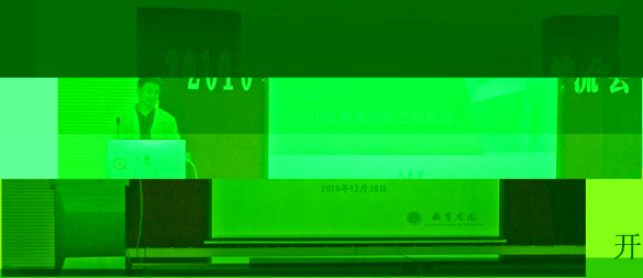
文东基院长对学院年度行政工作进行总结

学院财务情况，并布置了2011年度的工作。会后，教育学院新年联欢晚会在锡华商务酒店圆满举行，闵维方书记出席并致辞。